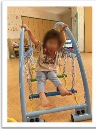
ゆらゆらレインボー橋、 たのしいね！

未就園児 5月の活動の一部です。 集団活動では、手遊び歌や絵本を見る集まりに参加したり、幼稚園のお遊戯室に遊びに行き身体を動かして遊ぶ時間も取り入れています。