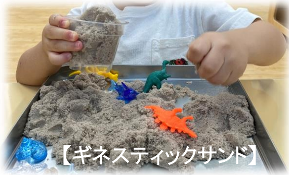
【ギネスティックサンド】

「スライム」「寒天」「手型スタンプ」「野菜スタンプ」 様々な活動を通して、不思議な感触に触れ、反応を 楽しみました。